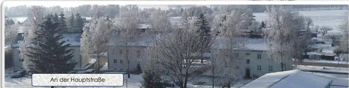
An der Hauptstraße