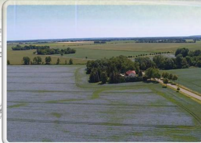
Leinblüte an der Oderchaussee