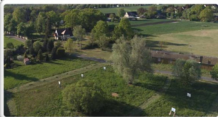
Baumlehrpfad an der Oderchaussee