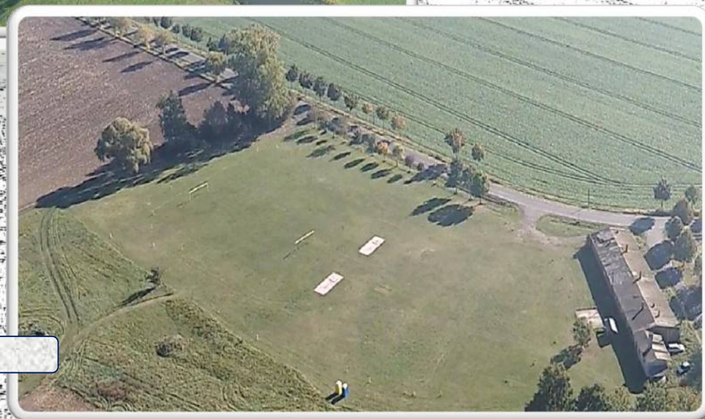
Wettkampfplatz der FFW