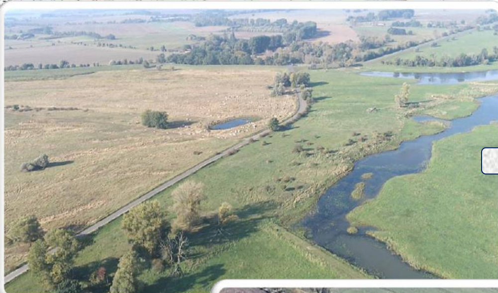
Straße zur Fährbühne